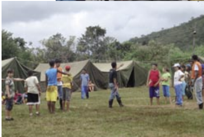
Acampamento dos adolescentes na CIFRATER

do movimento fraternista no Brasil, considerada o marco inicial do Movimento da Fraternidade – MOFRA.