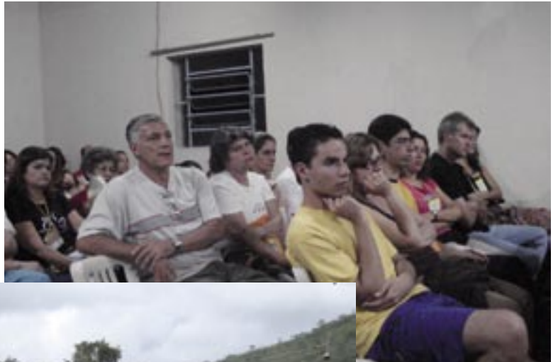
Palestra no Grupo da Fraternidade Espírita Irmã Veneranda

Em 29 de setembro de 1948, Francisco Cândido Xavier, psicografando no Centro Espírita Oriente, futuro Grupo da Fraternidade Espírita Irmã Sheilla, recebeu magnífica poesia do espírito Castro Alves intitulada "Apelo à Mocidade Espírita-Cristã", prenunciando o porvir